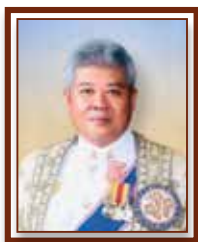
นายลลิต ถนอมสิงห์ รองเลขาธิการ กปร.