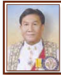
ม.ล.จिरพันธุ์ ทวีวงศ์ (เลขาธิการ กปร. คนที่ ๘)