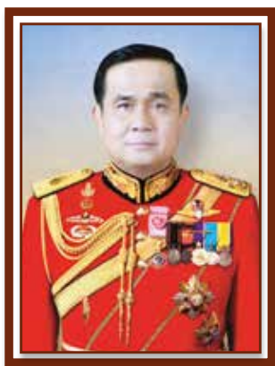
พลเอก ประยุทธ์ จันทร์โอชา

นายกรัฐมนตรี ประธานกรรมการพิเศษ เพื่อประสานงานโครงการอันเนื่องมาจากพระราชดำริ (กปร.)